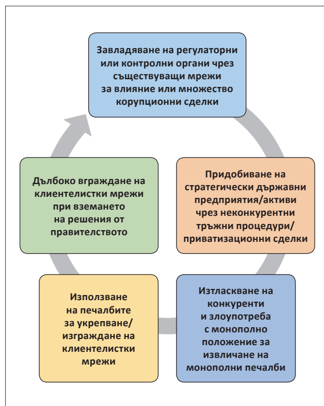
Фигура 3. Как Кремъл използва завладяването на държавата за постигане на политическо влияние

Източник: Център за изследване на демокрацията.